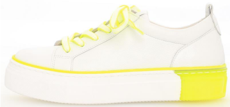
Trendy: Weißer Sneaker mit Neon-Akzenten