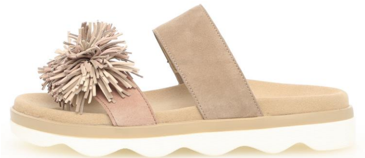
Pantolette mit weichem, ergonomischem mit Fußbett

Bei der offenen Ware wird das Angebot an Fußbett-Sandalen ausgebaut: Es gibt sie nun auch mit leichter Fersensprengung oder mit ausgeprägter, aber angenehm weicher Fußunterstützung.