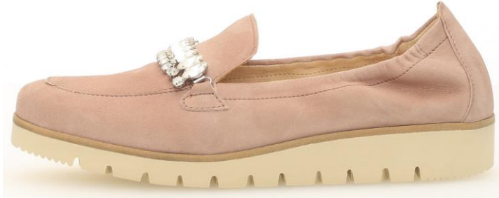
College-Typ mit Rock'n Roll Einfass

Neu sind Ballerinas mit Sprengung. Rock'n Roll Ballerinas erfreuen sich weiter großer Beliebtheit und werden ergänzt durch Rock'n Roll College-Typen.