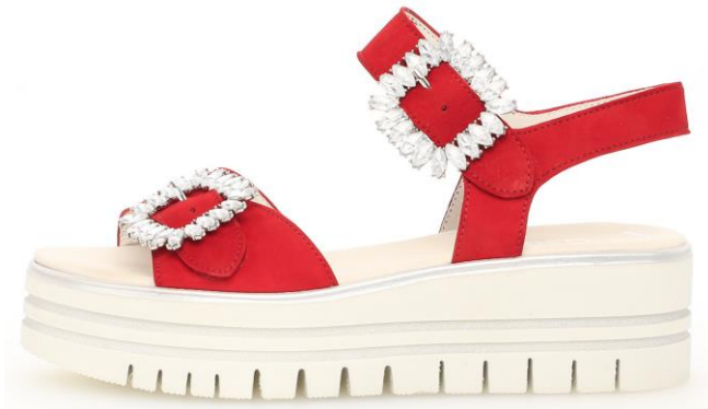
Sandalette mit aufwändigen Schmuck-Schließen