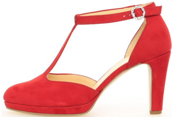
Neue gelenkoffene Pumps

Das Angebot der gelenkoffenen Pumps wurde ausgebaut. Im eleganteren Bereich findet man öfter Wellenschnitte am Schaft.