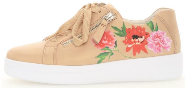
Blumendekors sind Trend