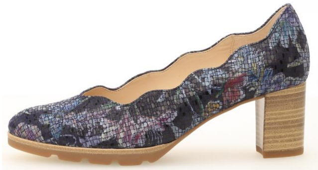
Pumps mit Wellenschnitt