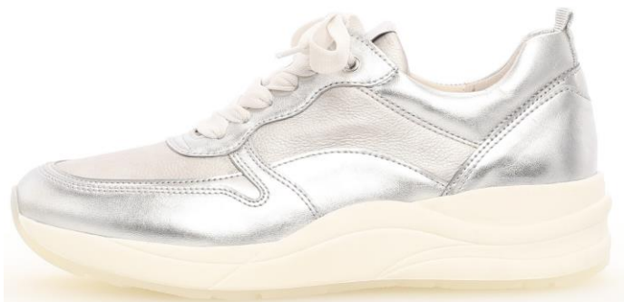
Sneakers im „Dad Style“ mit sehr markanter Sohle

Sneakers bleiben das Hype-Thema der Saison. Die Sohlen werden oft noch markanter und noch voluminöser. Voll im Trend und sind dabei Sneakers mit sehr markanter Sohle im „Dad Style“, der bei Gabor jedoch konsumiger interpretiert wird.