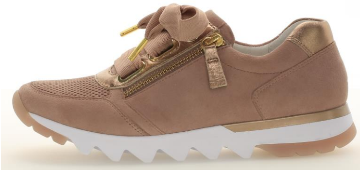
Betonte Senkel und längliche Deko-Ösen, markante Zackensohle

Für eine feminine Optik sorgen Details wie betonte Deko-Senkel und Ösen oder mehrfarbige Schalensohlen mit Streifen, Glitzer- oder Jutestreifen.