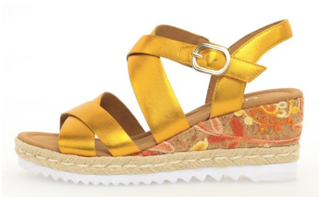
Aufwändig bestickter Keil aus Kork, dekorativer Espa-Flechtstreifen

Sandalen mit Plateau, zum Teil lederbezogen, sind gefragt. Aufwändig bestickte Korksohlen mit floralem Muster oder Espa-Flechtungen machen Keilsandaletten zu Hinguckern. Teilweise haben Sandalen hochgezogene Fersenkappen. Pantoletten sind meist schlicht. Leichte und flexible Slides sind neu im Angebot.