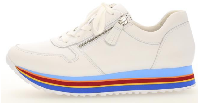
Sneaker in neutralem weiß, kombiniert mit auffälliger, gestreifter Sohle.

Wichtige Dekor-Elemente sind aufwändige Schließen, Perlenoptiken und dekorative Bommel aus feinen Lederstreifen. Blumendrucke kommen teils als Hauptmotiv, teils als Akzent. Besonders bei Sneakers gewinnen Ösen und Schnürsenkel, z.B. aus Satin oder in Form breiter Kordeln, als Deko-Element weiter an Bedeutung. Mehrfarbig gestreifte Sohlen stehen vor allem Sneakers gut. Schäfte werden aufgewertet mit Druck, Strick und Paillettendetails. Betonte Strassoptiken gehen zurück.