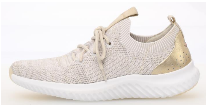
Rollingsoft mit Strickschaff

Mit ihrem speziell entwickelten Natural Running - Boden kombinieren rollingsoft sensitive Schuhe den Vorzug der Abrollsohle mit perfekter Flexibilität: Unabhängig voneinander bewegliche Elemente ermöglichen dem Fuß höchste Bewegungsfreiheit. Rollingsoft sensitive kommen in einem sehr sportiven Design in den neuen Trendfarben. Sie sind federleicht, verfügen über eine hochwertige Lederausstattung und Wechselfußbetten. Neu bei rollingsoft sind Strickschäfte.