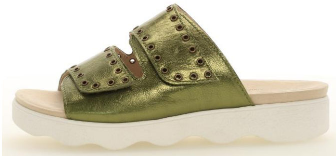
Pantolette mit wellenförmiger Sohle

Die Böden werden als Design-Element noch wichtiger. Betonte, kräftige Sohlen aus federleichtem Material sind voll im Trend. Schalensohlen werden noch voluminöser und kommen vielfach mit strukturierter Optik. Weiß bleibt auch bei Sohlen wichtig, aber oft sind die Sohlen auch farblich auf das Obermaterial abgestimmt. Sohlen mit unterschiedlichen Streifen, teils glänzend, teils multicolor geflochten oder mit Naht ergeben einen frischen Look. Wellenförmige Sohlen sind ebenfalls beliebt.