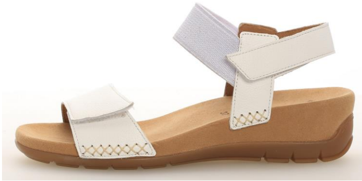
Fußbett-Sandalette mit Fersensprengung

Sandalen mit Plateau, zum Teil lederbezogen, sind gefragt. Aufwändig bestickte Korksohlen mit floralem Muster oder Espa-Flechtungen machen Keilsandaletten zu Hinguckern. Teilweise haben Sandalen hochgezogene Fersenkappen. Pantoletten sind meist schlicht. Leichte und flexible Slides sind neu im Angebot.