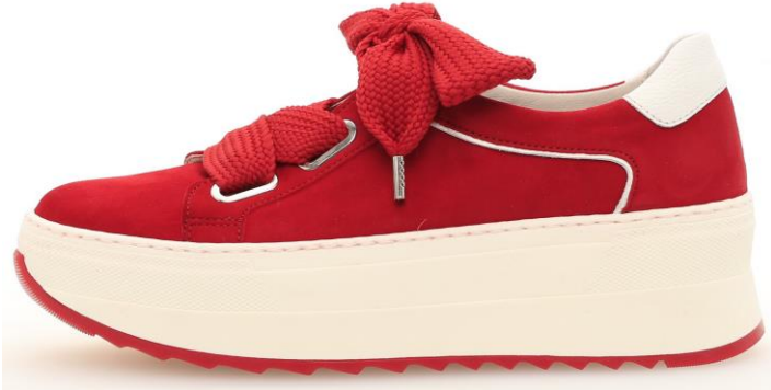
Modische und hoch flexible Schalensohle

Schalensohlen (Cupsoles) werden in der modischen Spitze noch massiver, bleiben bei Gabor aber immer hoch flexibel.