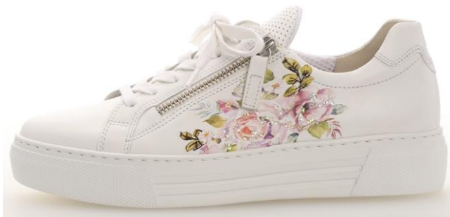
Sneaker mit aufwändiger Verzierung am Schaft: Hier werden Druck, Strick und Pailletten kombiniert