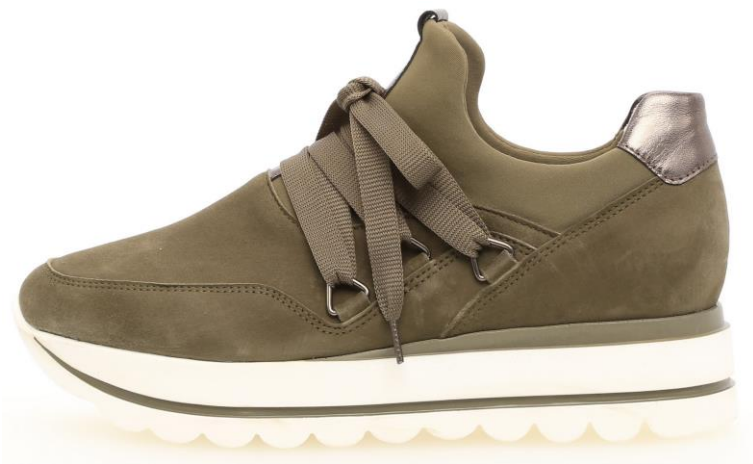
Sneaker mit Neopren-Schlupf